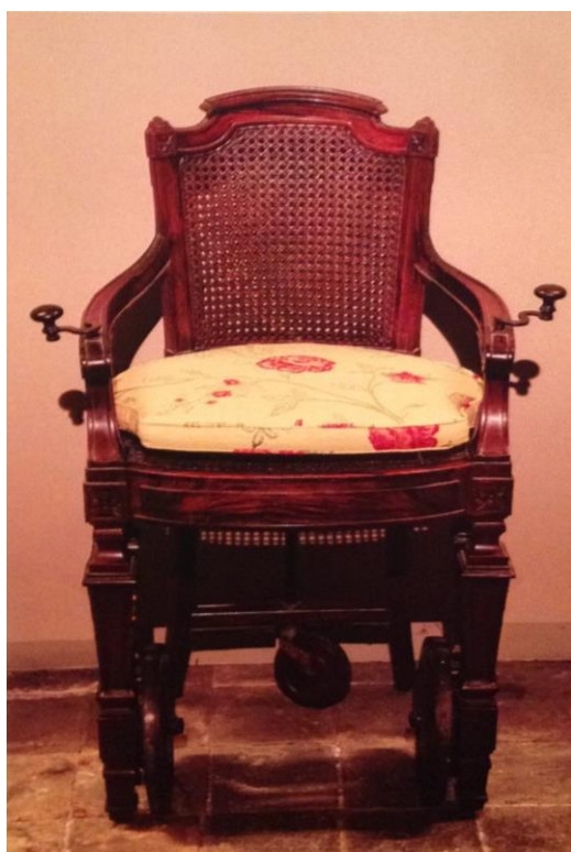
La sedia da gotta proveniente da dimora nobile veneziana (epoca Luigi XVI)

In mostra persino una rarissima sedia da gotta proveniente da antica dimora nobile veneziana. Questo "sapere portatile" è oggi affascinante estetica e allo stesso tempo storica testimonianza dell'evoluzione medica e dei costumi sociali in età moderna.