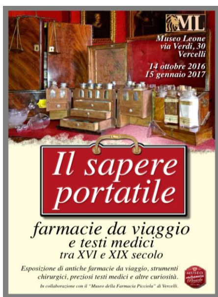
La copertina del catalogo della mostra

Una mostra in collaborazione con il Museo della Farmacia “Picciòla” di Vercelli