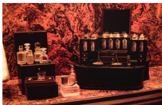
Due delle farmacie portatili in esposizione (epoca metà '800)