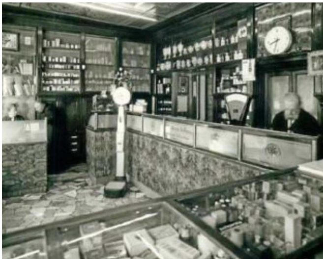
Antica Farmacia Alla Madonna di Thiene

Queste modifiche sono state eseguite in data 24 novembre 2014, e non dovrebbero comportare problemi perché la procedura interna della banca prevede l'aggancio del vecchio IBAN con quello nuovo. (potrebbero verificarsi problemi per i soci esteri dell'area non euro es. svizzeri, e paradossalmente per i correntisti di Banca Intesa S. Paolo se fanno il bonifico direttamente in cassa.