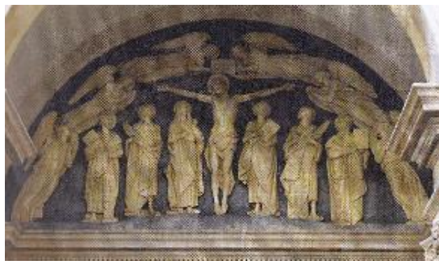
Opera (1973) di Adolfo Rollo sovrastante il portale della basilica raffigurante i Santi Cosma e Damiano con la Madonna e i Santi Giacomo, Pietro e Paolo

I santi nati nel III secolo ad Egea, città della Cilicia nell'attuale Turchia esercitavano l'arte del curare senza accettare compensi (Anargiri). Lo studio dei loro attributi nelle raffigurazioni artistiche è di grande interesse per gli storici della farmacia perché documenta gli strumenti utilizzati da medici e farmacisti nel corso dei secoli. Il calendario si può richiedere a info@basilicalberobello.com o telefonando al 080 43 21 021