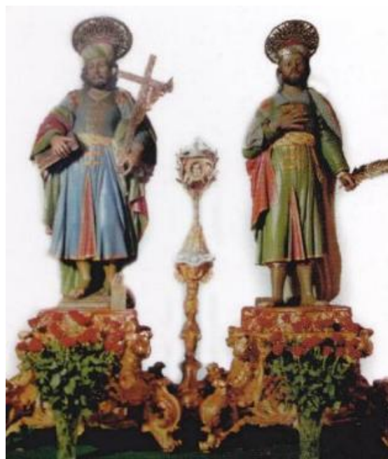
Santi Medici Cosma e Damiano Basilica e Santuario Parrocchia Alberobello

È alla sua cinquantanovesima edizione il calendario 2015 dei SS Medici pubblicato dalla Basilica Santuario di Alberobello.