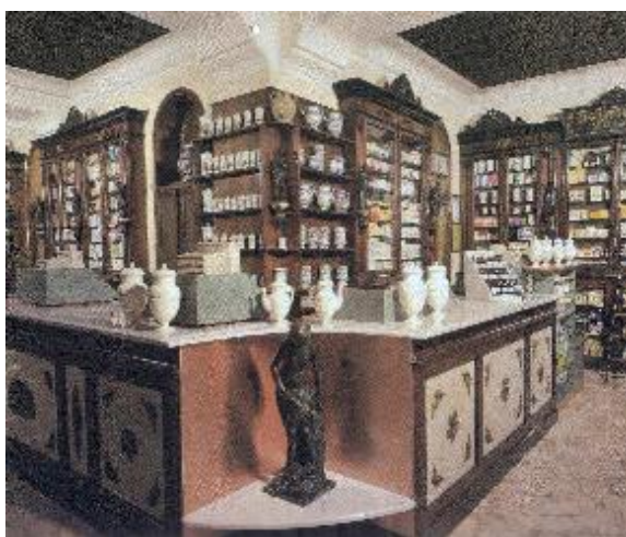
Farmacia del Lazzaretto, Milano via Panfilo Castaldi 29

Dopo la visita alla collezione Bayer i congressisti verranno riaccompanati in centro città seguendo un percorso che porterà alla visita di alcune farmacie storiche milanesi scelte a seconda della disponibilità e dell'apertura (Santa Teresa, Del Lazzaretto, Diana ed eventualmente Ca' Granda). I dettagli verranno specificati nel programma definitivo.